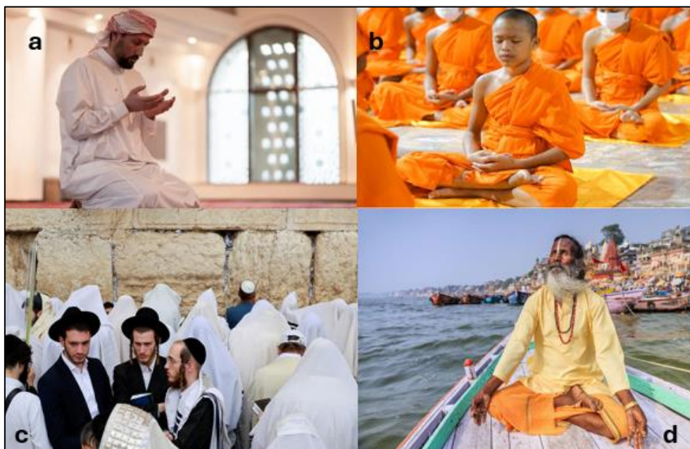
Fig. 2 Reprezentanți religii - Asia

În imaginile de mai jos sunt prezentați reprezentanți ai unor religii din Asia.