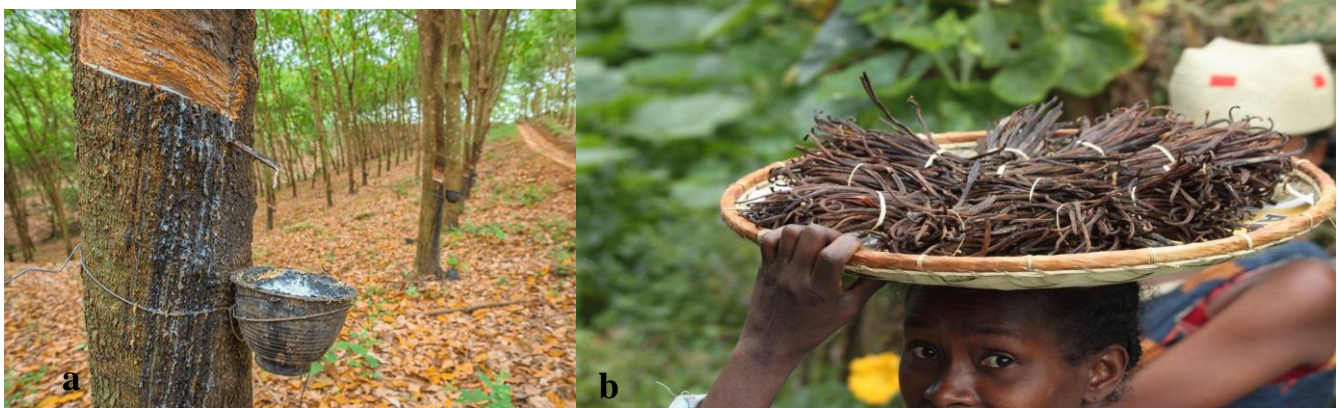
Fig. 4 Culturi agricole

În imaginile de mai jos sunt surprinse două plante extrem de utilizate la nivel mondial.